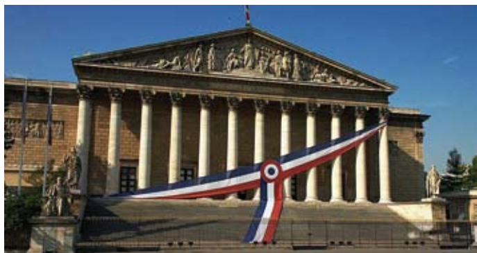
Le Palais-Bourbon est le nom communément donné au bâtiment qui abrite l'Assemblée nationale.

Chaque député ne représente pas uniquement sa circonscription mais la France tout entière. Il détient un "mandat national" : c'est en pensant aux intérêts de tous les Français, où qu'ils vivent, qu'il doit prendre ses décisions, notamment lors du vote des lois.